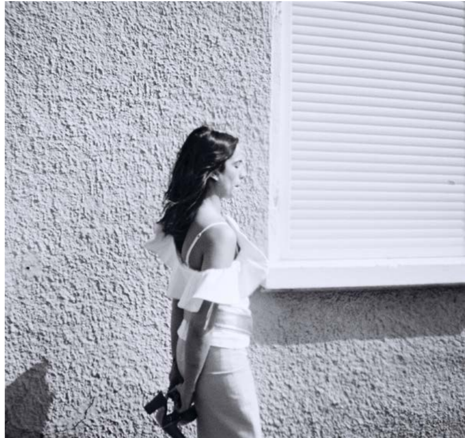
Escarpin SICILE Tressé Rouge