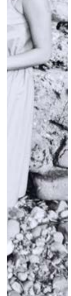
Mocassin 2100 Vernis Blanc