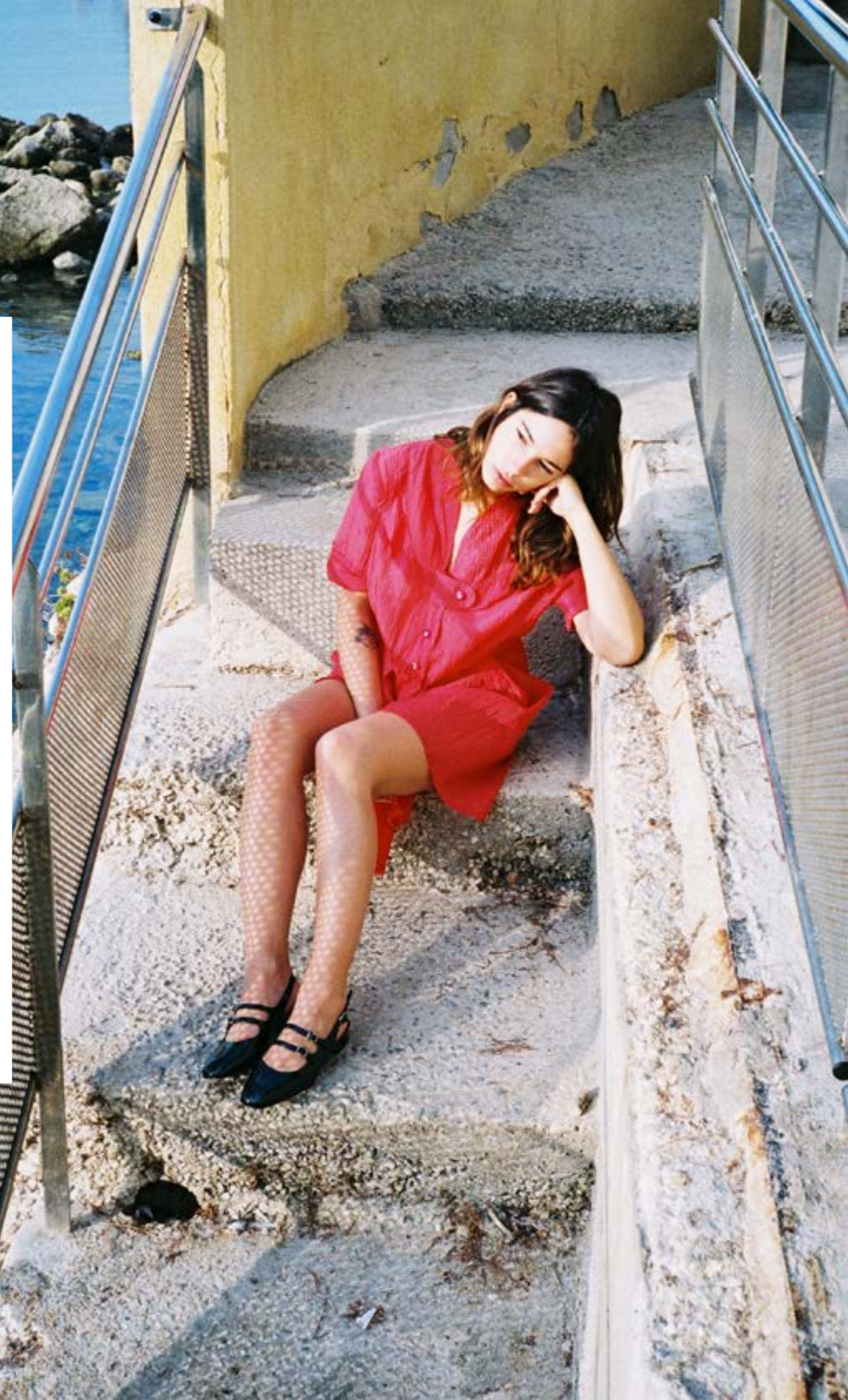
Babies PÊCHE Vernis Noir