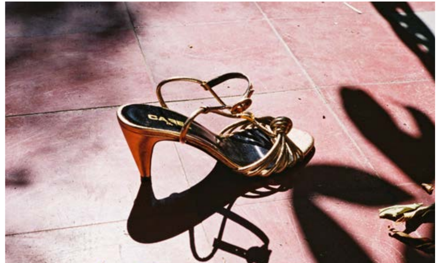
Escarpin SONYA Laminé Doré