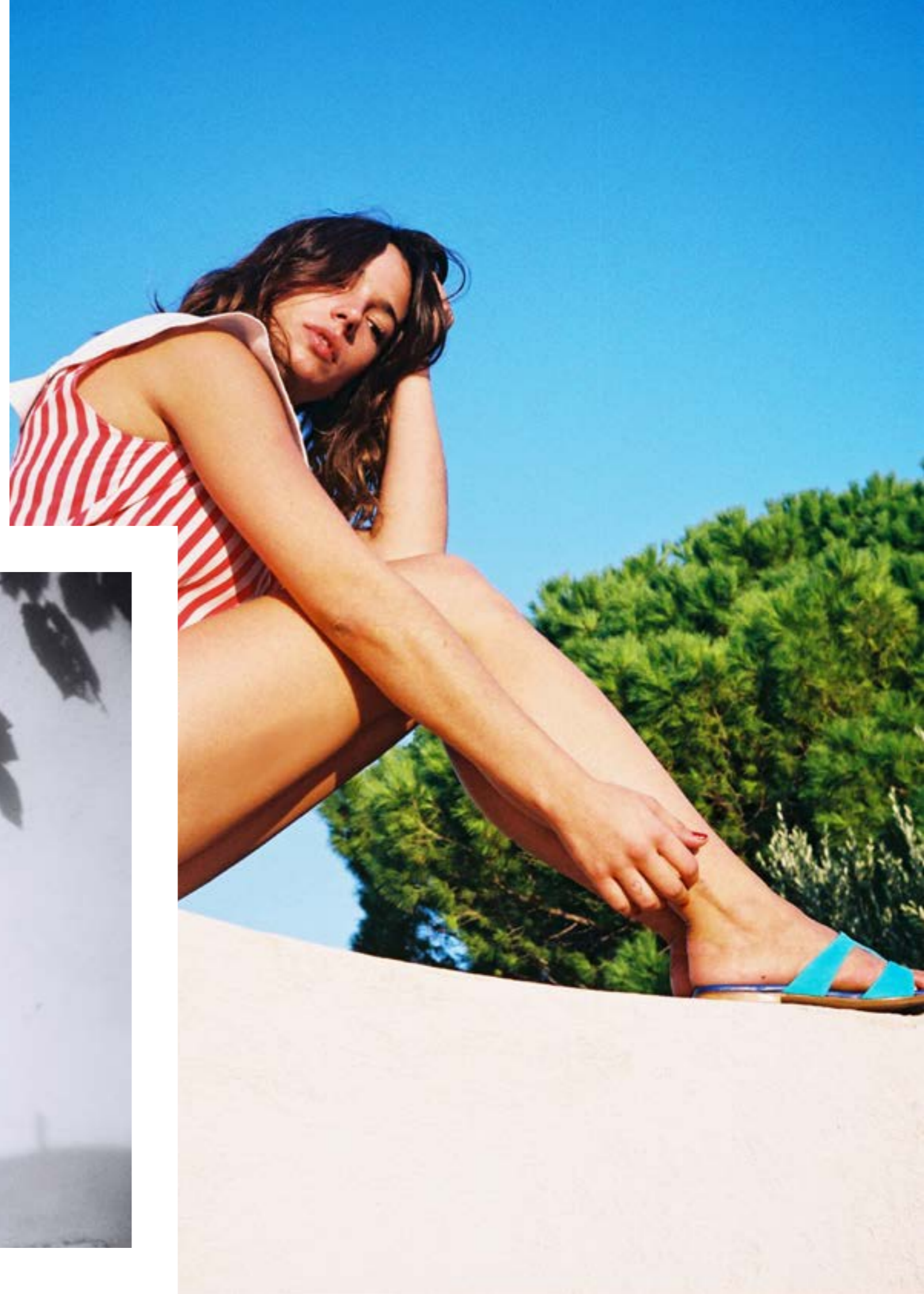
Sandale LEIA Velours Bleu