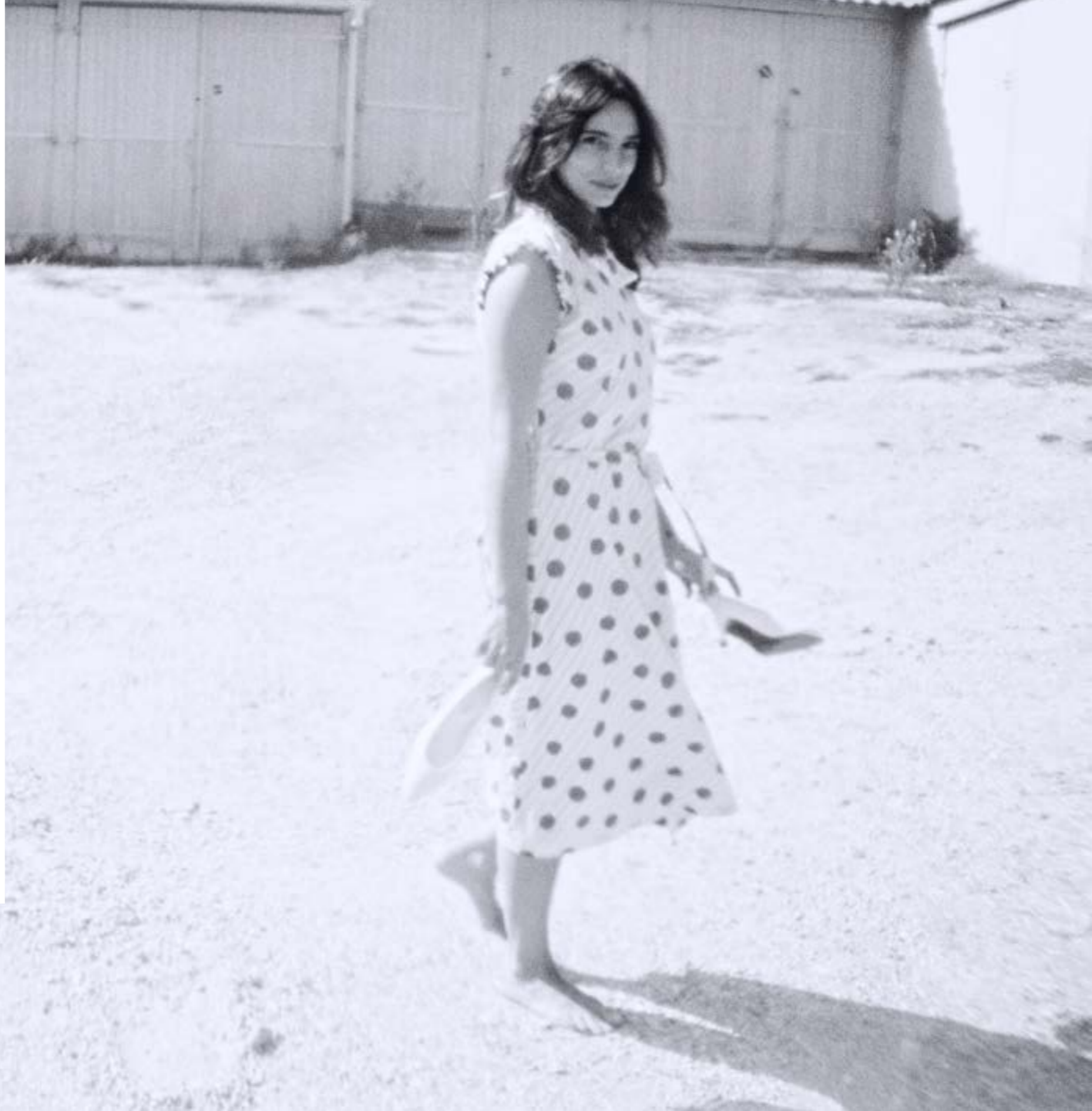
Escarpin MAGIE Cuir Blanc