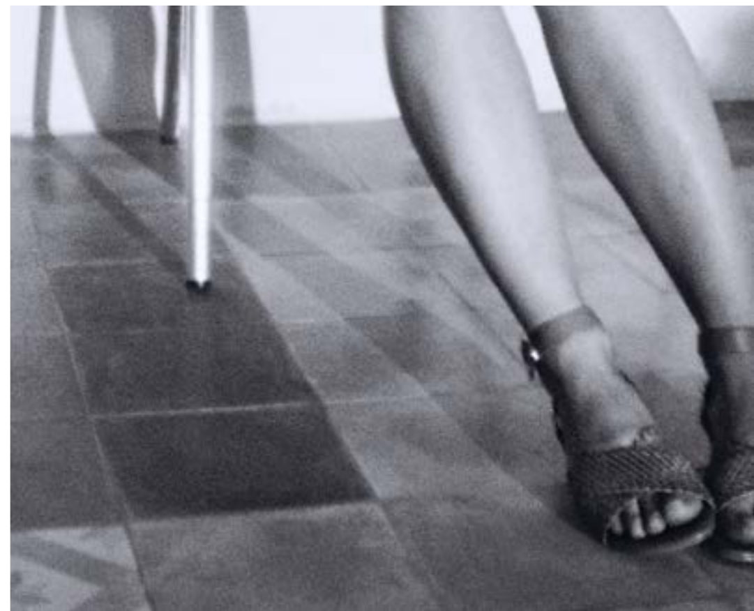
Sandale SIRÈNE Tressée Marron